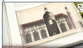
El panteó dels catalans il·lustres