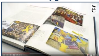
El llaç groc