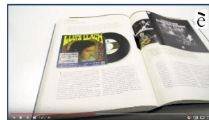
L'estaca de Lluís Llach