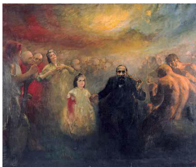
Al·legoria del doctor Robert (c. 1902, oli sobre tela, © MNAC)

—Vaig néixer al número 66 del que abans tothom anomenava la Rambla del Mig, la dels Caputxins, a dues passes mal comptades del Cafè de l'Òpera, davant del Liceu. La quantitat d'històries i llegendes que té aquest tram de carrer... Durant una època, fa més de dos-cents anys, era el rovell de l'ou de Barcelona. Allà és on vaig viure una bona part de la meua vida, i allà, sense saber per què, és on vaig a petar cada cop que el cap em fa una mala passada; ja ho sap, quan vaig a la deriva. Quin magnetisme especial deu tenir per a mi aquell número 66?