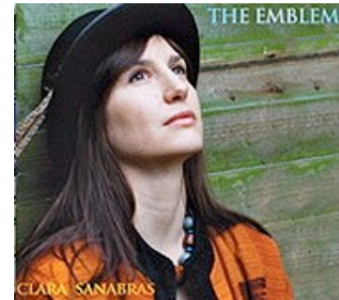
The Emblem (2011)