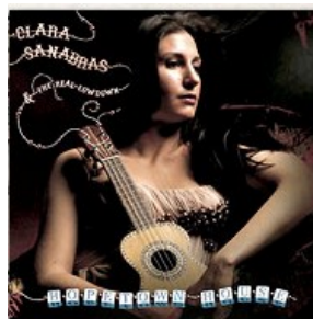
Hopetown House (2009)