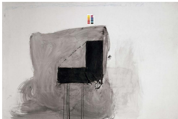
A la memòria de Salvador Puig Antich - 1974

Procediment mixt sobre tela - 200 x 300 cm