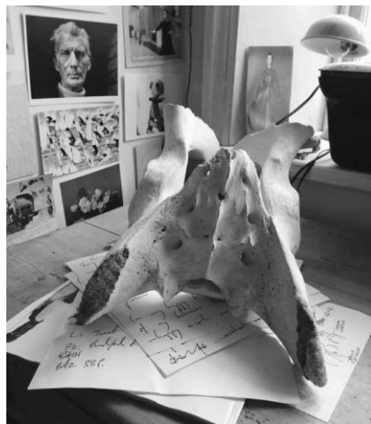
Pelvis d'os polar (Bath, 2016).

Uns anys després, el meu pare em va dir que havia trobat aquella estructura ossia al gel de les glaceres del Kongsfjorden, tot i que, amb el pas del temps, la història va canviar i va resultar que l'havia bescanviada per pastissos i estris amb el metge de l'expedició. La pelvis va residir a l'estudi de les diferents cases on vam viure durant la meua infantesa; era un artefacte alienígena, més que no pas un trofeu. Semblava tan pura i sobrenaturalment blanca. En sostenir-la, era més pesant del que es podia esperar. Em tenia encisat.