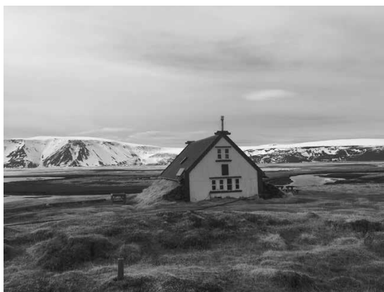
Hvítárnes (Islandia).