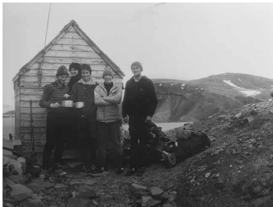
Hotel California a Ny-Alesund (Svalbard, 1982).