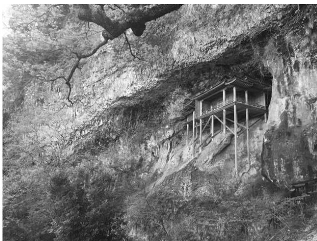
投入堂 Nageire-dō (Japó).

Dan Richards és coautor de Holloway (amb Robert Macfarlane i Stanley Donwood) i autor de The Beechwood Airship Interviews i Climbing Days .