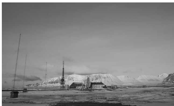
Isfjord Radio (Svalbard).