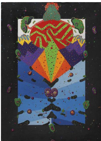
Zush - Braenia

Àlex Mitrani , direcció i selecció d’obres