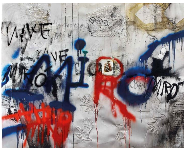
Antoni Clavé | Homenatge a Joan Miró Pintura sobre alumini | 153 x 193 cm | 1972 Sala Gaspar, Barcelona

Entre els artistes que van participar d'aquesta aventura hi destaquen grans mestres participants de les primeres avantguardes, com Miró, Dalí o Clavé, però també els nous Tàpies, Ponç, Cuixart, Guinovart, Ràfols Casamada o Hernández Pijuan, consagrats al llarg d'aquests anys.