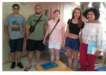
Sessions de treball de Barcelona i Tarragona