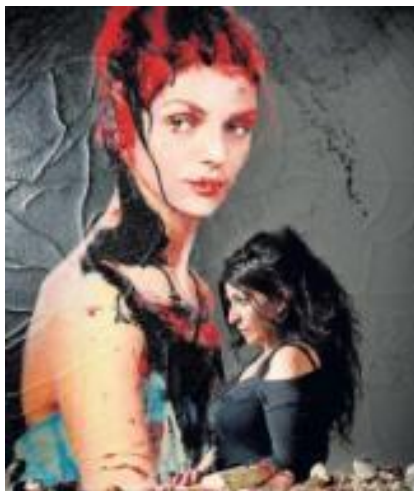
Lita Cabellut, padrina de Gralles Experience 2016